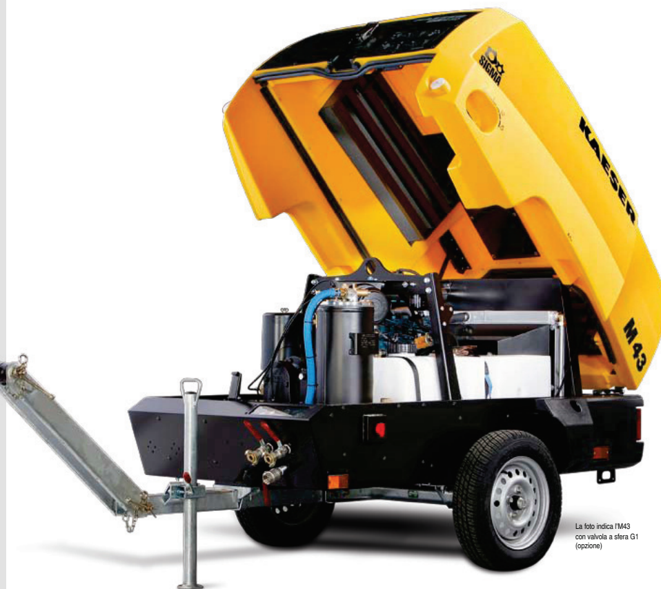
La foto indica l'M43 con valvola a sfera G1 (opzione)